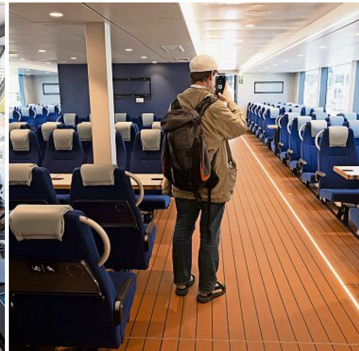
L'«Évian-les-Bains» peut accueillir jusqu'à 700 passagers. Il devrait naviguer dès l'automne prochain.