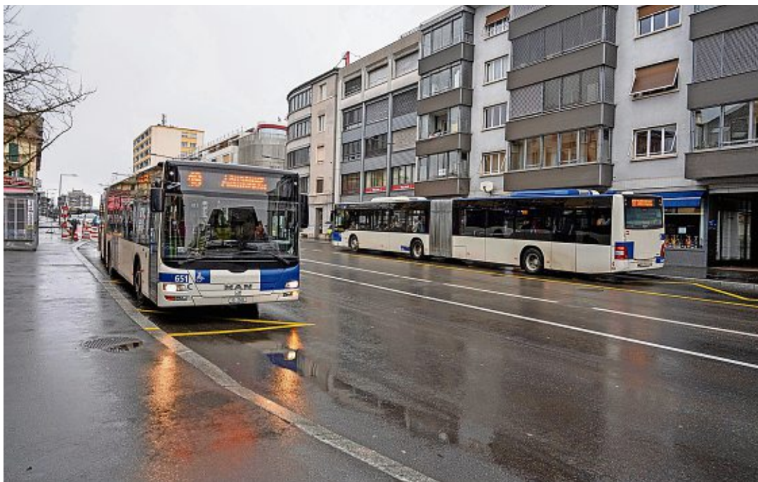
Dès le 26 février, la ligne 17 n'ira plus jusqu'à la place de l'Europe, mais jusqu'à Vigie. Pour compenser, la ligne 19 entre Renens et Chauderon a été renforcée.