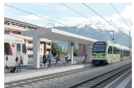
La nouvelle gare de Monthey avec le projet de sécurisation de l'AOMC entre Collombey et Monthey