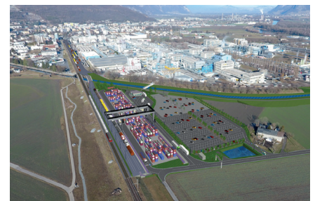
Le futur terminal régional de Monthey