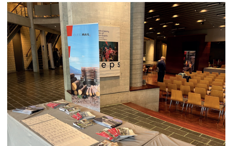
L'assemblée générale s'est tenue au Théâtre du Crochetan.