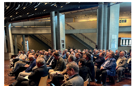
Près de 120 participants s'étaient déplacés à Monthey