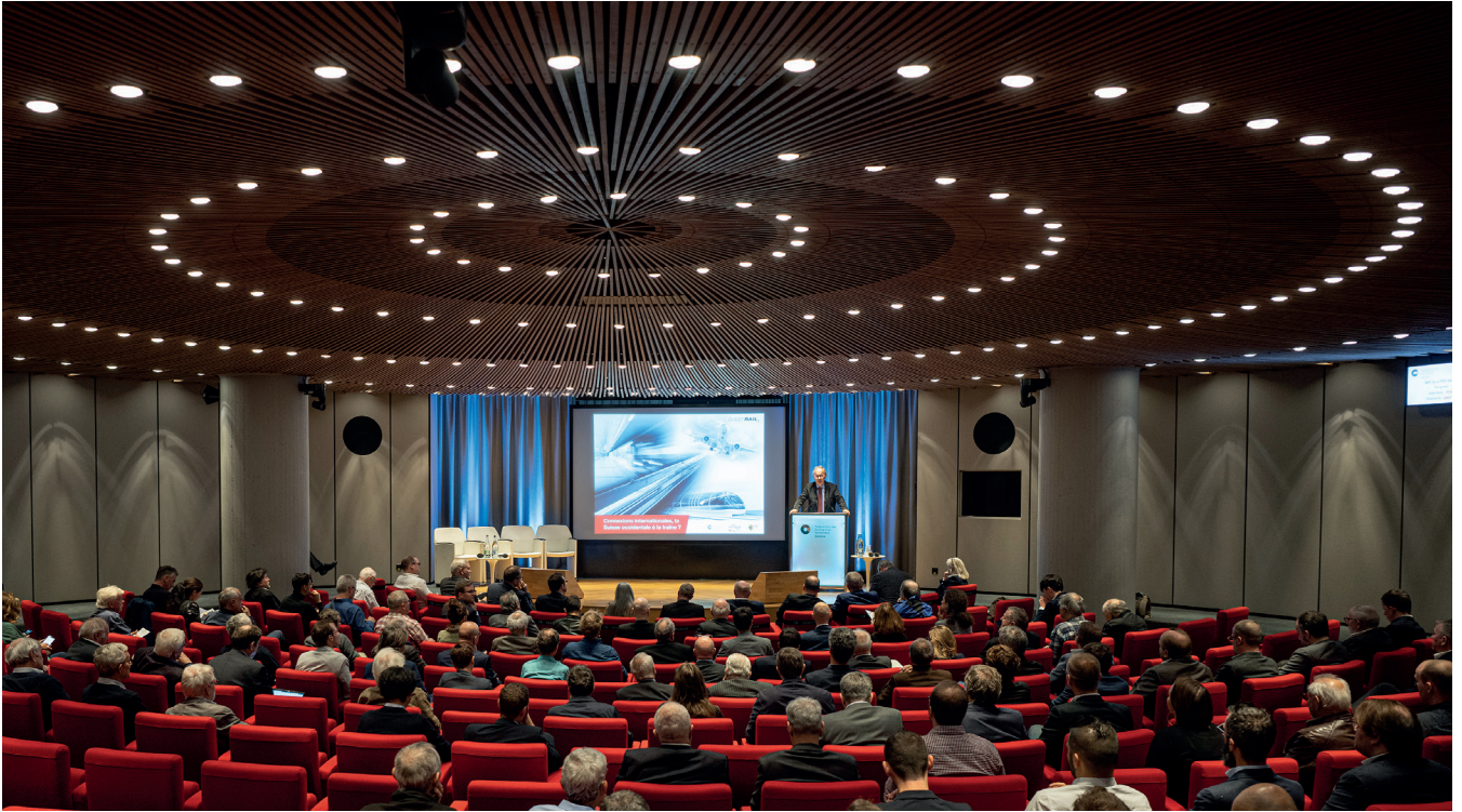
Un public nombreux pour cette 18 ème édition.