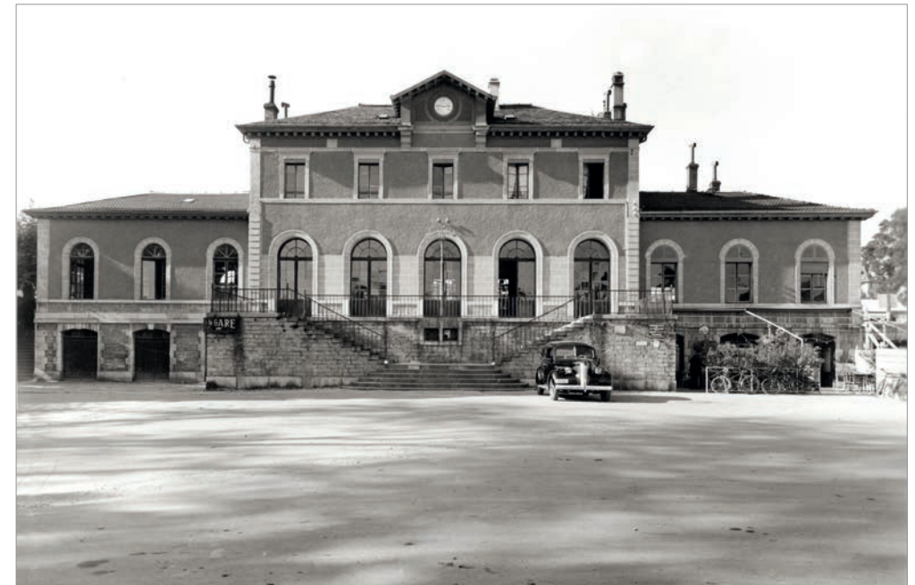
1948. Bâtiment aux voyageurs.

En vente dans les librairies de Morges Commande par mail : info@museebolle.ch En souscription jusqu'au 30 octobre 2022 (voir au dos)