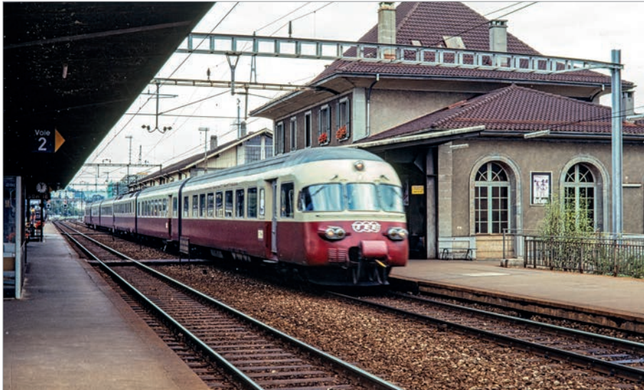
1981. TransEuropExpress. (Jean Vernet)

1855 marque l'inauguration de la première liaison ferroviaire de Suisse romande, Yverdon-Morges. Elle était le lien entre le lac de Neuchâtel et le Léman, car à l'époque le trafic était surtout lacustre. Le bâtiment de la gare de Morges date, lui, de 1861. Aujourd'hui, il est appelé à disparaître et doit céder la place à une construction beaucoup plus importante qui sera réalisée en prolongement du bâtiment Sablon Gare-Rail. Autre époque, autre échelle.