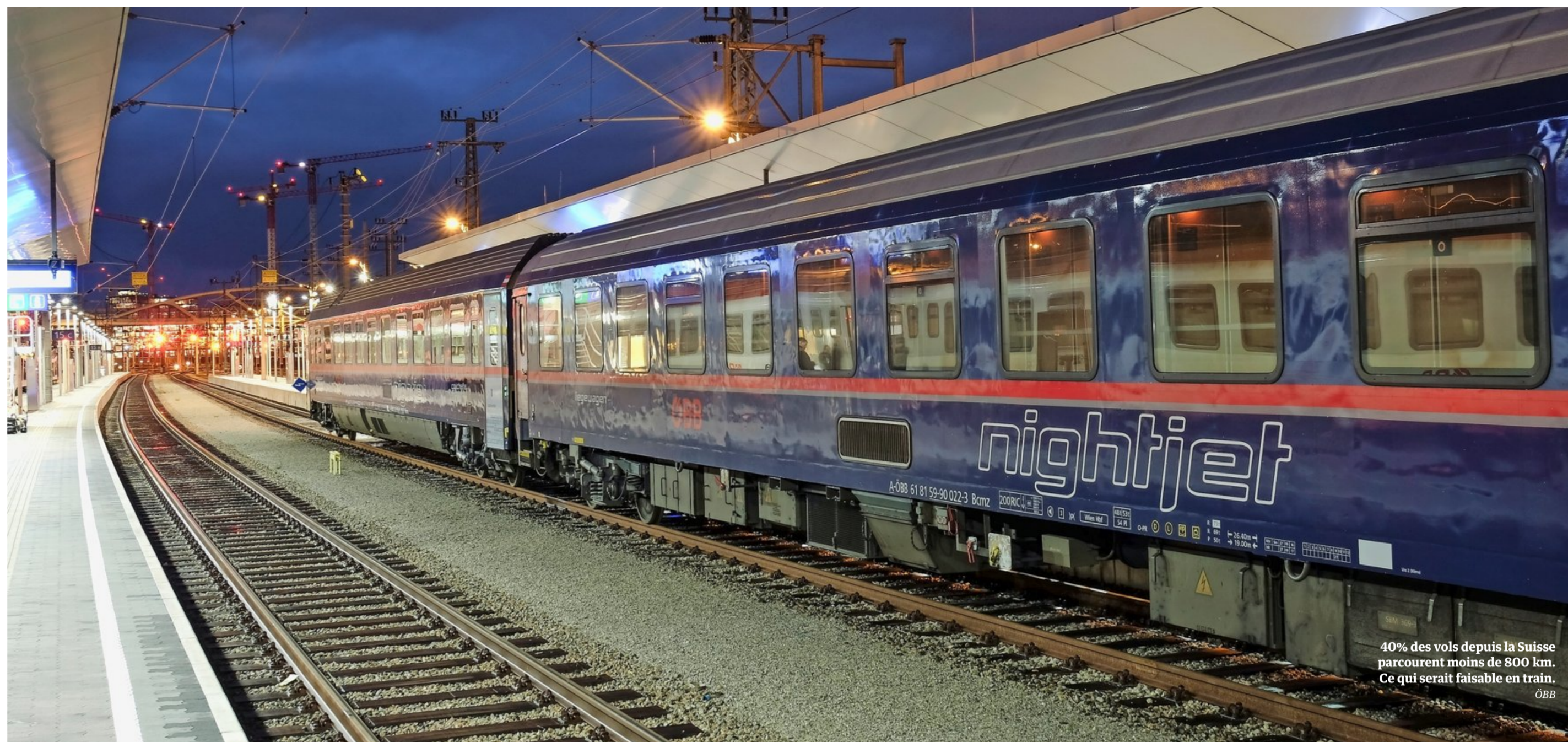
40% des vols depuis la Suisse parcourent moins de 800 km. Ce qui serait faisable en train. ÖBB

Florian Egli, vice-président du think tank sur la politique étrangère suisse Foraus, et chercheur à l'EPFZ