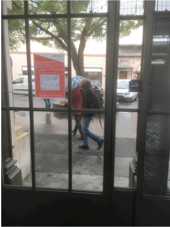
Vevey, 3 octobre 2017 : deux petites affichettes A4, avec horaires très incomplets, sur une porte coulissante ; seule information écrite aux voyageurs.

Dès leur réponse, rapide et positive, ils ont placé de grandes affiches, l'information en gare est redevenue correcte.