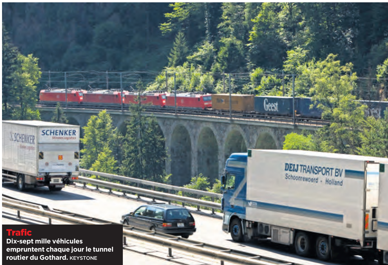
Trafic Dix-sept mille véhicules empruntent chaque jour le tunnel routier du Gothard.