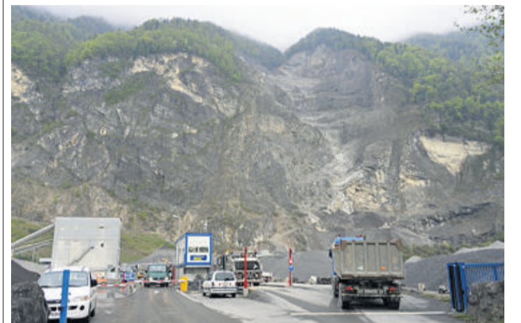
L'exploitation des carrières ne cesse de faire l'objet d'inquiétudes des élus locaux. PATRICK MARTIN