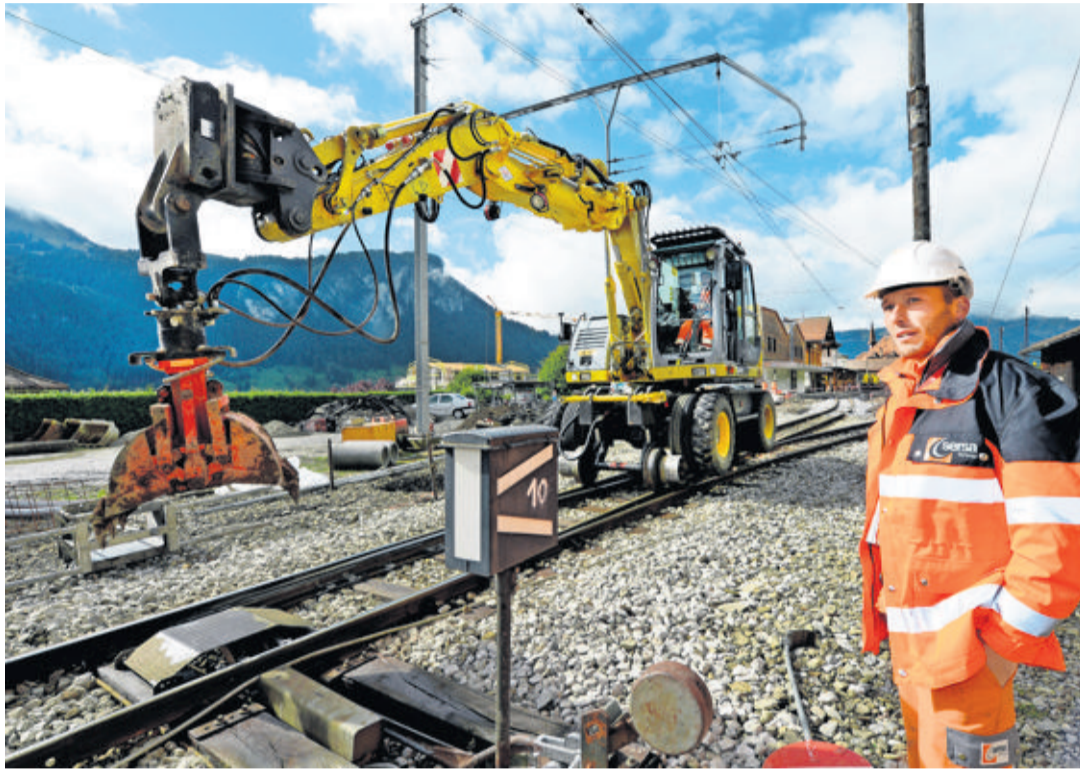
A Château-d'Œx, les travaux pour accueillir le TransGoldenPass ont commencé. Estimés à 20 millions, ils dureront deux ans. D'autres gares devront aussi être réaménagées.

Les futures rames du TransGoldenPass atteindront près de 200 m