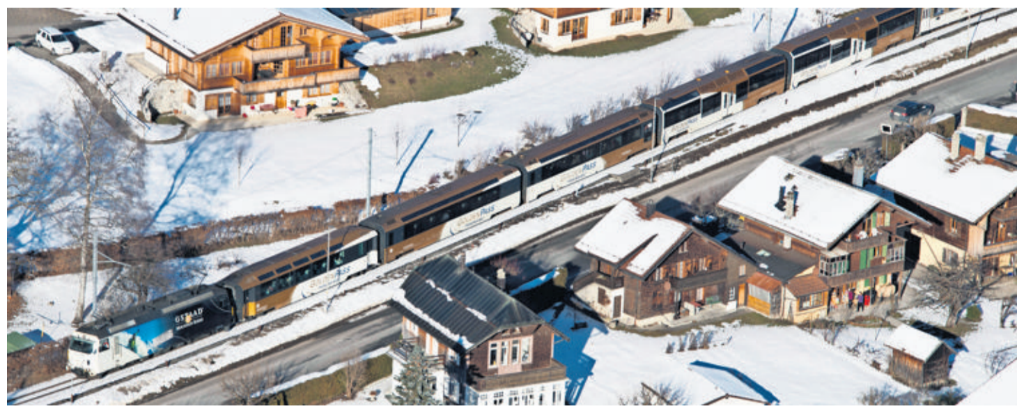
LE MOB dans le Pays-d'Enhaut, où les gares doivent être réaménagées pour accueillir le TransGoldenPass. FLORIAN CELLA