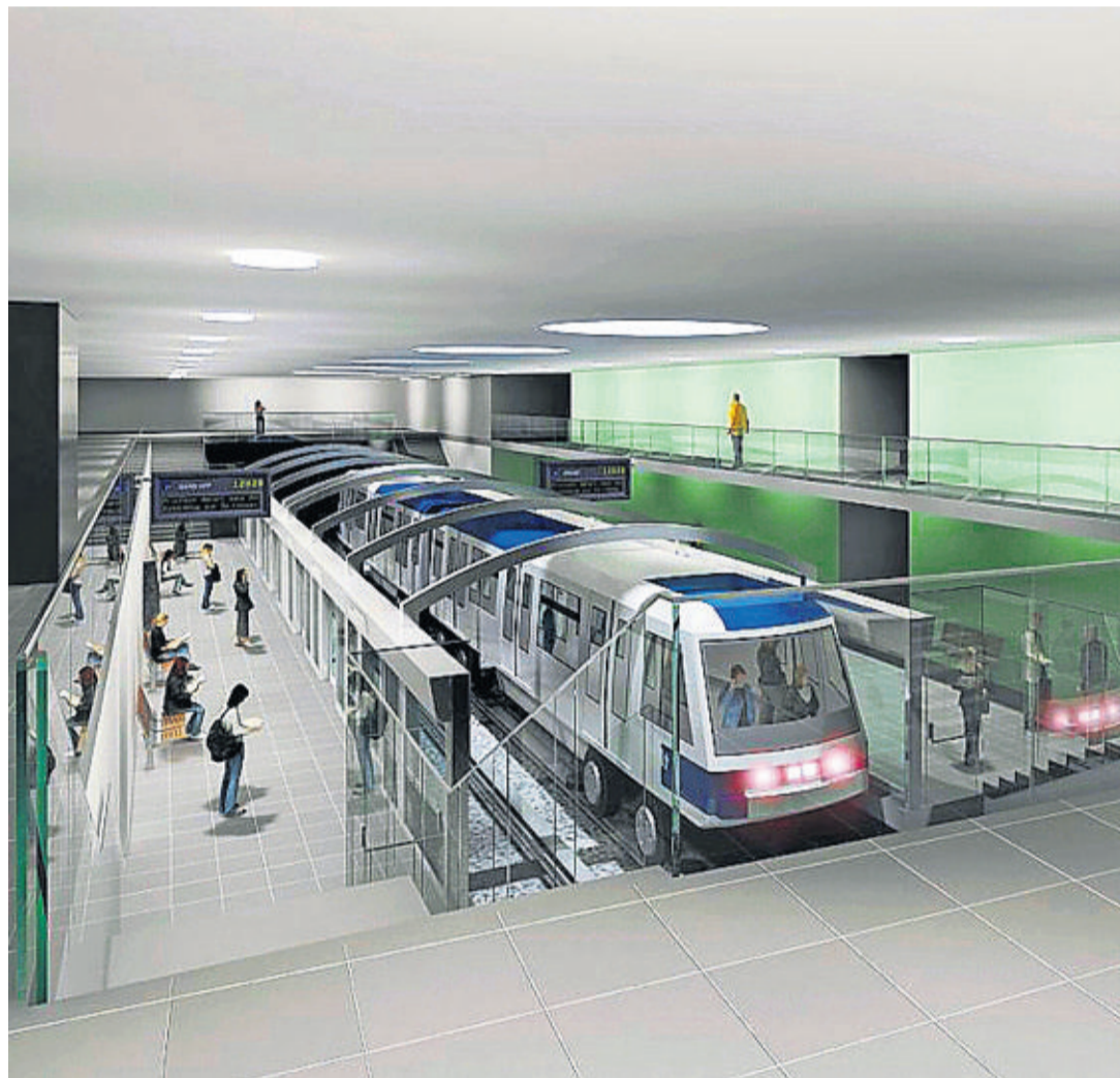
Aujourd'hui, une question reste en suspens: les 47 millions accordés par la Confédération permettront-ils au M3 d'aller jusqu'à Chauderon (image de synthèse), ou s'arrêtera-t-il au Flon?

des transports (OFT), partisan de la création de son petit frère.