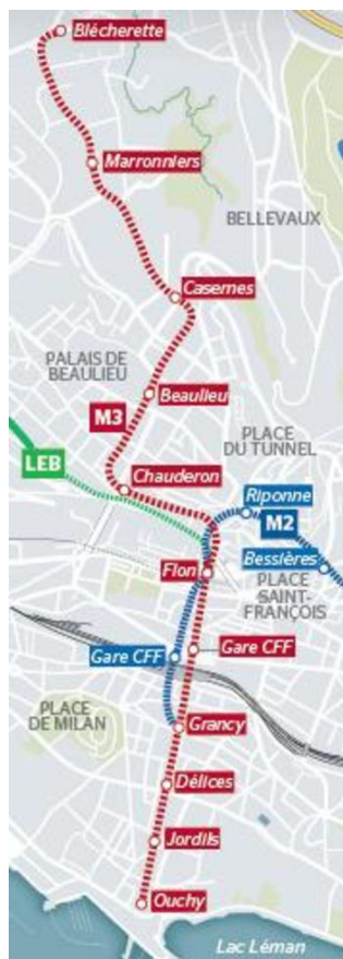
La plupart des lignes relieront Ouchy à la Blécherette, tandis que l'actuel M2 relierait de Grancy à Epalinges.

Une étude inédite de la ville et des TL et une manœuvre radicale arrachent aux élus un plébiscite en faveur du métro.