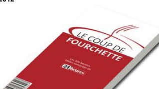
La référence incontournable de tous les gastronomes romands en vente dès Fr. 29.-