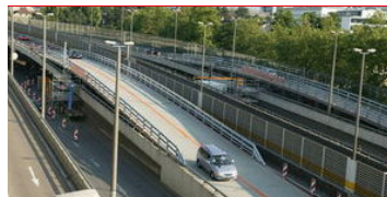
A Ecublens, les voitures passeront au-dessus des ouvriers en train de rénover l'autoroute. Le «fly over» débarque ce week-end.