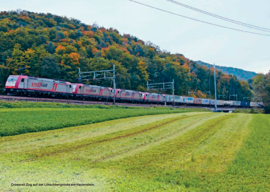
Crossrail-Zug auf der Lötschbergroute am Hauenstein.