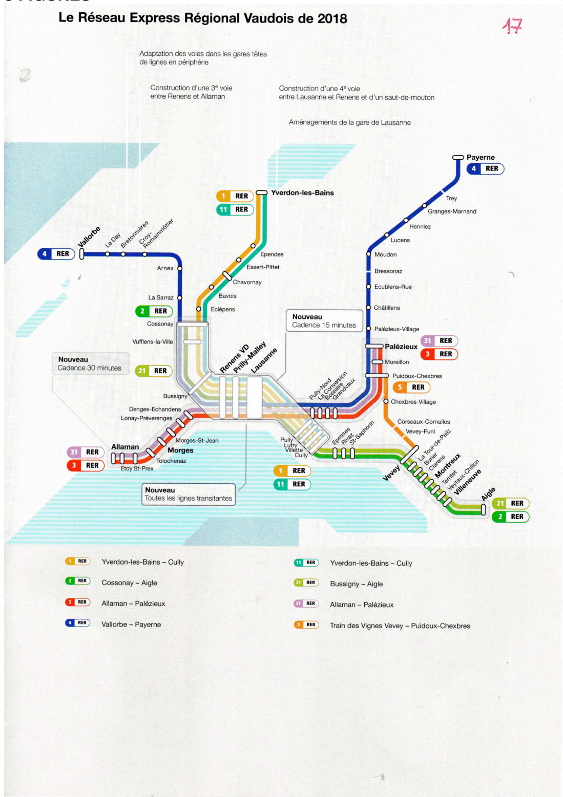
Fig.1 Schéma du Réseau express régional (RER) vaudois à l'horizon 2018 [1].