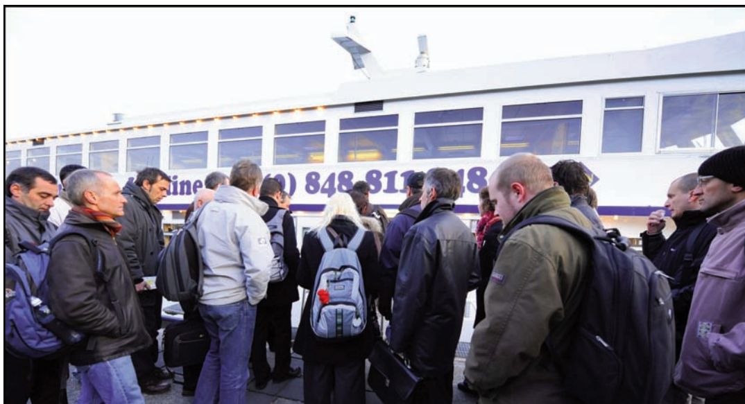
Le trafic des travailleurs frontaliers ne cesse de croître sur le Léman.

- A la fin mai, nous devions probablement atteindre +20 %. La fréquentation touristique, grâce à la météo et à la qualité de nos prestations, est pour moitié dans la