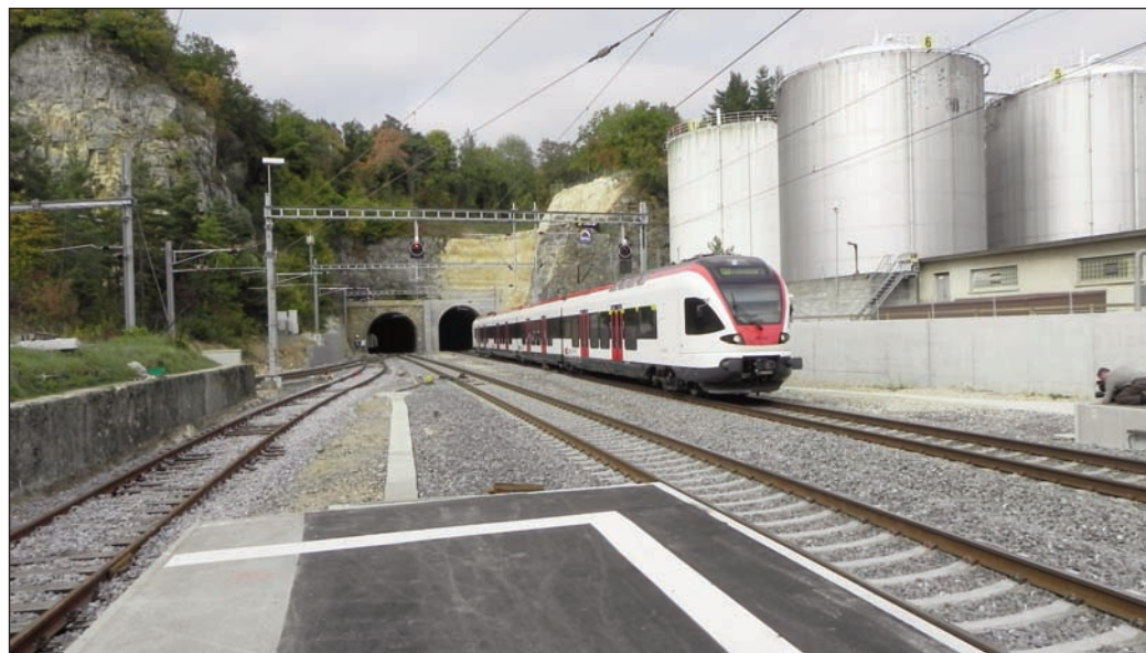
Le double tunnel du Mormont, à Eclépens, est conçu pour le passage des rames à deux niveaux.

C hangement de têtes, changement de stratégies. C'est en quelque sorte le grand chamboulement qui a saisi le Département fédéral de l'environnement, de l'énergie, des transports et de la communication (Detec) ainsi que l'Office fédéral des transports (OFT) à la suite des mutations à la tête de ces deux organismes.