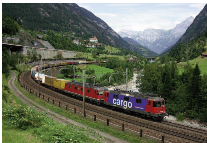
Seuls les trains ne dépassant pas la limite des 3m80 aux angles peuvent actuellement transiter par le Gothard.

Qu'en est-il avec le futur axe du Gothard? Un élément de moyen terme, la réfection lourde du tunnel routier qui devrait être fermé durant une année, perturbe la nécessaire vision d'ensemble. En effet, quoi qu'il en soit, cette fermeture ne pourra survenir qu'en 2017, après l'ouverture du tunnel ferroviaire de base (trains de camions en transit), de façon à pouvoir offrir une alternative crédible, en combinaison, limitée dans le temps, avec l'utilisation de l'ancien tunnel de faite ferroviaire, parallèle au tunnel routier (navettes pour le transport des autos). Bien sûr, le tunnel de base pourra absorber tous les trains de camions de quatre mètres de hauteur d'angle, mais en