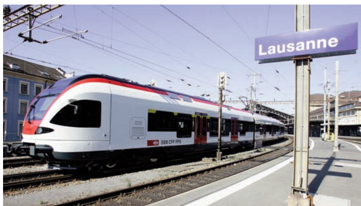
Le visage de la gare de Lausanne sera remodelé.