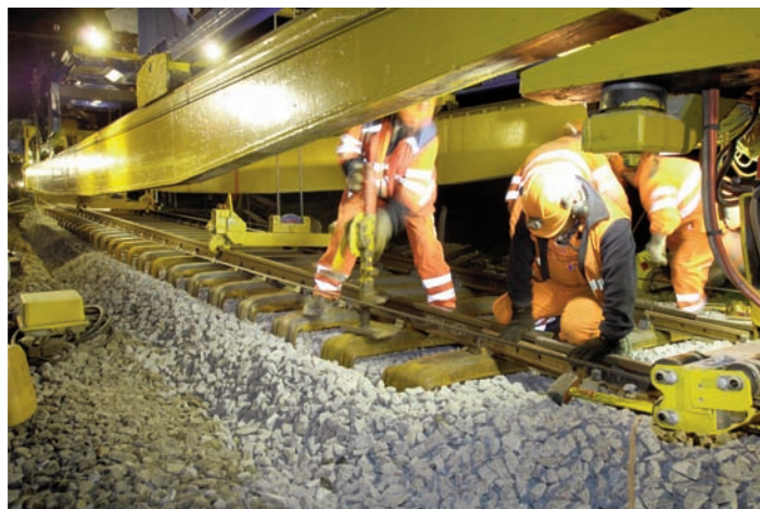
Le Pusal: machine impressionnante de remplacement de voie. (sp/sch)

La DRL est un exemple concret de machine conçue pour la topographie du réseau suisse. Cette machine permet de cribler le ballast dans les zones particulièrement étroites (le long des quais, dans les