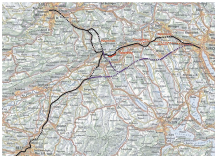
Les variantes entre Olten et Zurich. En noir: réseau actuel. En rouge: variante CFF du Honeret, avec les nouveaux tunnels de l'Eppenber, du Chestenberg et du Honeret (5,77 milliards de francs suisses). En bleu: LGV Roggwil-Altstetten avec barreau Olten-Schöffland selon le projet Hans Bosshard et Jürg Perrelet (6,3 milliards de francs suisses).

La première partie de cet axe, de Berne à Olten, est une ligne nouvelle (tunnel du Grauholz et ligne rapide de Mattstetten à Rothrist, le fleuron de Rail 2000), qui satisfait à la fois aux exigences de capacité (quatre voies continues de Berne à Olten) et de vitesse (200 km/h de Mattstetten à Rothrist). La seconde section, de Rothrist à Zurich, fait l'objet de tous les débats. Les arguments d'Oskar Baumann, l'ancien chef du bureau d'étude des CFF et auteur d'un projet de ligne directe entre Berne et Zurich, en 1969, ont été suivis à la lettre pour la réalisation de sa première étape, de Berne à Olten, mais sont manifestement tombés aux oubliettes de l'Histoire