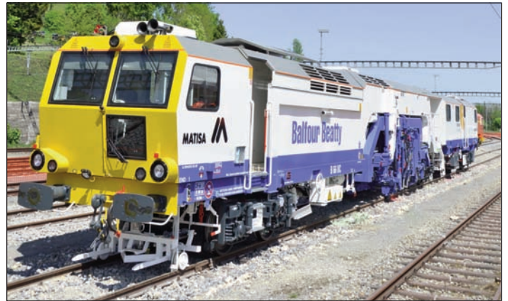
Une machine de chantier ferroviaire Matisa au chevet de la voie. (sp)

travail des trains de renouvellement afin d'abaisser la voie durant le remplacement de cette dernière;