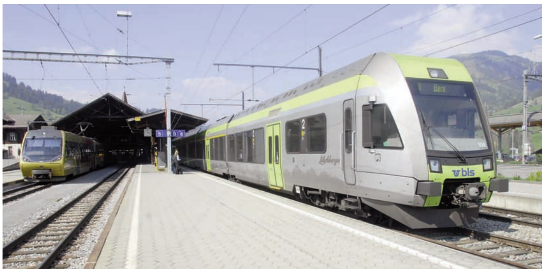
Rames du MOB (Goldenpass) et du BLS en gare de Zweisimmen.

Présentée comme un sursaut indispensable, la nouvelle offre TransGoldenPass a été limitée au parcours Montreux - Interlaken par pragmatisme (limitation de la prise de risque). Il y a aussi des raisons de mercatique (le changement de train à Interlaken est moins péjorant du fait du comportement du public qui ne se contente pas de transiter via cette région mais aspire à la visiter) et technique. La première génération de bogies à écartement variable ne sera en effet