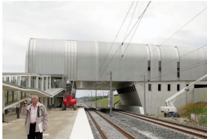
Gare de Belfort-Montbéliard TGV face au sud de la gare.

L'aventure n'est pas achevée, puisque Réseau ferré de France (RFF), propriétaire des infrastructures, a engagé quatre opérations d'extension de son réseau, aux-