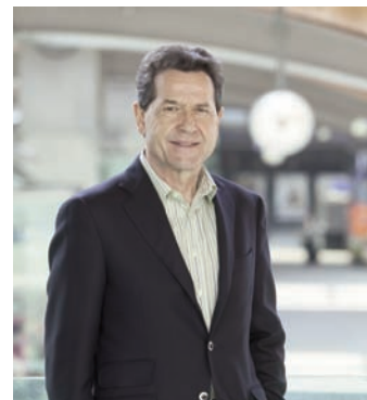
Le président Ulrich Gygi.

A propos de la hausse des billets, Ulrich Gygi rappelle que les CFF et les autres compagnies sont confrontées à de grands défis: entretien d'un réseau de plus en plus sollicité; hausse de la capacité par de nouvelles rames; construction de tronçons neufs pour décharger un réseau engorgé. Il faut donc trouver les ressources nécessaires, dans la mesure où les Chambres n'accordent que peu de crédits complémen-